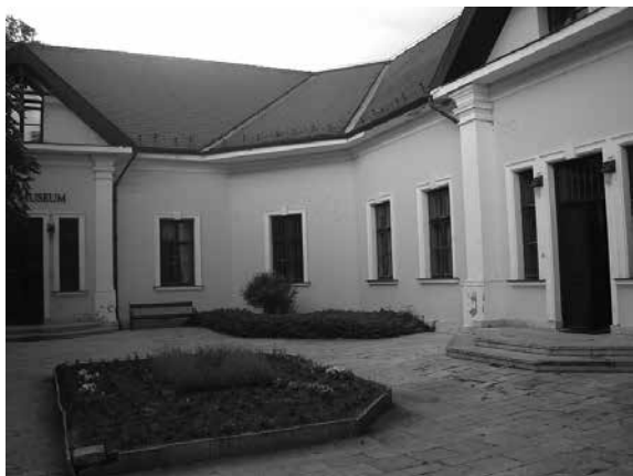
Архив Српске православне епархије будимске

Рад на прикупљању, евидентирању, заштити и сређивању архивске грађе у Сентандреји започео је 1984. после иницијативе која је потекла из Архива Србије 1970. године. Од 1984. до 1991. године делатност Архива Србије базирала се на Протоколу о сарадњи између СФРЈ и Републике Мађарске у области заштите и истраживања споменика историје и културе оба народа. Због немилих догађаја на просторима бивше Југославије дошло је до прекида званичне сарадње, али је рад на заштити, сређивању и обради архивске грађе настављен захваљујући финансијским средствима која су обезбедила Будимска епархија и министарства културе Републике Србије