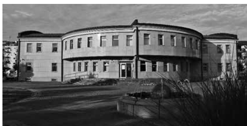
Zgrada Arhiva Brčko distrikta BiH

Donošenjem Zakona o arhivskoj djelatnosti Brčko distrikta Bosne i Hercegovine 2004. godine 38 uređena je oblast arhivske djelatnosti na području Brčko distrikta BiH, pa su samim tim stvoreni i formalni uslovi za osnivanje Arhiva Brčko distrikta BiH. Uslijedila je izgradnja administrativnog objekta (zgrada Arhiva Brčko distrikta BiH) u okviru kompleksa bivše kasarne u Brčkom 39 , započeta 2003. godine, sa isključivom namjenom odlaganja arhivskog materijala sa pratećim sadržajima kako je navedeno u tekstu idejnog rješenja gradnje objekta. 40 Arhiva Vlade Brčko distrikta uselila se u prizemlje zgrade, zauzevši prostor depoa i dvije kancelarije. Ukupan kapacitet i pokretnih i prevoznih-pokretnih regala u arhivskom depou je 3.844,80 metara dužnih polica za smještaj arhivske građe i 540,8 dužnih metara završnih polica dubine 400 mm.