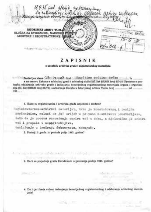
Zapisnik o pregledu arhivske građe i registraturnog materijala, Istorijski arhiv Tuzla, Služba za evidenciju, nadzor i zaštitu arhivske i registraturne građe, od 13. VI 1975. godine

materijala po odobrenju Arhiva grada Tuzla, obavljeno 1964. godine, što govori o tome da je stručni nadzor nad ovom registraturom otpočeo mnogo ranije. Zapisnik o izlučivanju bezvrijednog registraturnog materijala iz 1964. godine nije sačuvan. Kao što je u zapisniku iz 1968. godine zabilježeno, prijetila je opasnost od uništenja građe. 5