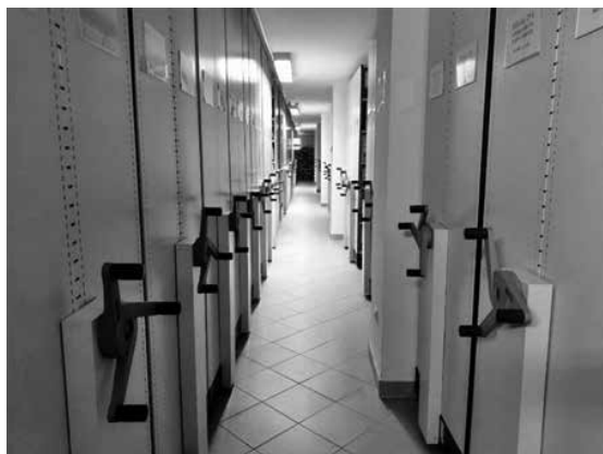
Arhiva Vlade Brčko distrikta BiH

do 2017, u ukupnoj dužini od oko 200 metara, kao i dokumentacija matične kancelarije Vlade Brčko distrikta BiH u rasponu godina 1945. do 2016, u ukupnoj dužini od 35 metara, ali operativno je neophodna u redovnom poslovanju ovih odjeljenja Vlade Brčko distrikta BiH.